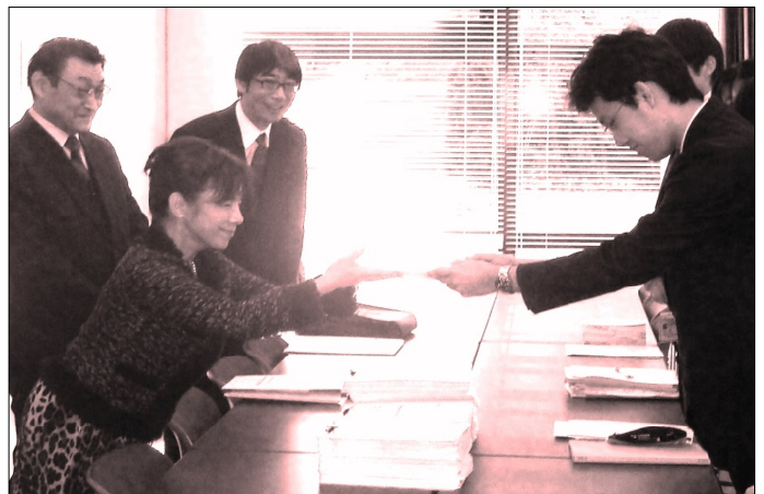
署名一次分16,042筆を提出（2月17日）

志子さんら4氏が呼びかけ人となり、実行委員会で準備がすすめられています。21・老福連もこの行動に全国の職場から参加して取り組んでいる要望署名も厚労省に提出します。