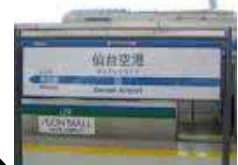
仙台空港鉄道 (仙台アクセス線)