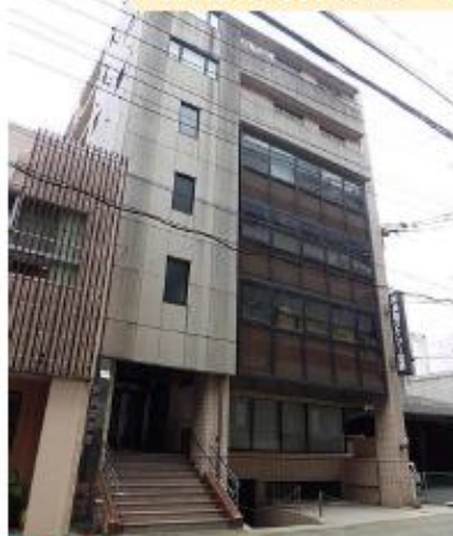
1日目会場:長崎タクシー会館

ACCESS: 路面電車 出島駅 徒歩約4分 〒850-0862 長崎県長崎市出島町 12-20