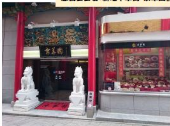
懇親会会場:新地中華街『京華園』

ACCESS: 路面電車 新地中華街駅 徒歩3分 〒850-0842 長崎県長崎市新地町 9-7