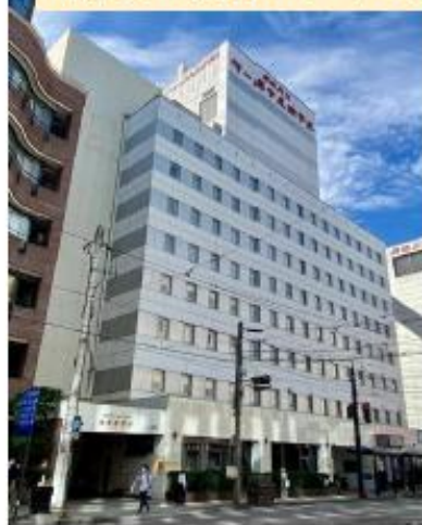
宿泊ホテル:長崎バスターミナルホテル

ACCESS: 路面電車 新地中華街駅 徒歩1分 〒850-0842 長崎県長崎市新地町 1-14