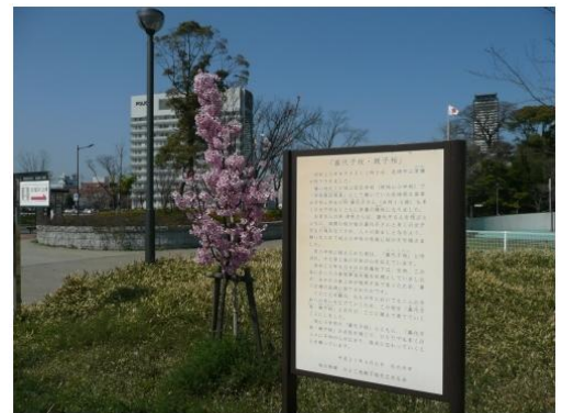
勝山公園(小倉北区)