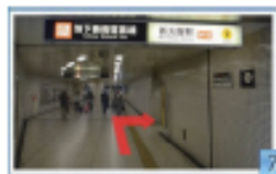
8 地下鉄御堂筋線の右側の 2番出口階段を下ります。