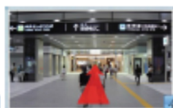
5 北口 新大阪阪急ビルに進みます。 新幹線中央口からは右方向です。