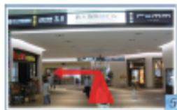
6 つきあたりを左に曲がり、 コンコースエスカレーターで 2階に下りる。