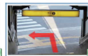
3 階段を下りきったら左へ。