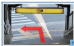
9 階段を下りきったら左へ。