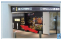
7 エスカレータを下りて、 正面の地下鉄御堂筋線の方へ 進みます。