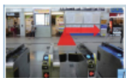
1 JR 東海道線 東出口を右折。 新幹線の場合は中央口を出て右へ (4の案内からご覧下さい)