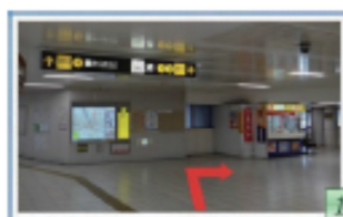
1 地下鉄御堂筋線北出口を出て 2番出口へ向かって下さい。