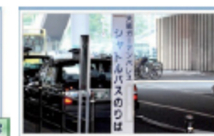
4 シャトルバス乗り場に到着です。