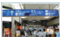
2 西口方面に進みます。