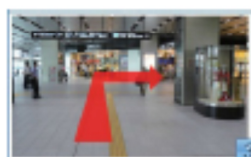
3 新幹線中央口、 中央きっぷうりば方面へ。