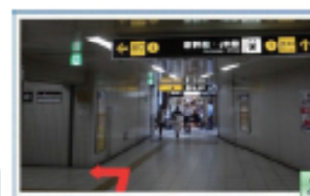
2 地下鉄 2 番出口を下ります。