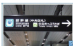
4 新幹線中央口、 中央きっぷうりば方面へ。