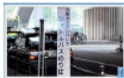
10 シャトルバス乗り場に到着です。