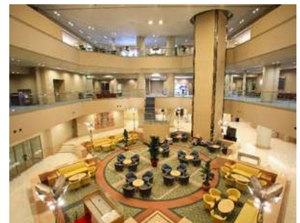
吹き抜けの広いロビー