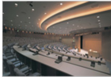
全体会場となる講堂

今回の職員研究交流集会の会場は、ホテルコスモスクエア国際交流センターです。研修特化型のホテルで、設備が整っていてとてもきれいな施設です。USJや海遊館などの観光スポットにも近くて観光をするにも便利なところです。宿泊するお部屋も広々としていて快適な感じですが、ホテルの周りにはお店などがなくて少し寂しい感じもしますが、ホテルの敷地内にコンビニがあるので便利です。