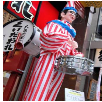
今は無き くだおれ人形

阪神タイガースが優勝した時、ファンが橋から川に飛び込むシーンをTVで見たことがある方も多いのではないのでしょうか？あの川が道頓堀川で、その周辺が道頓堀と呼ばれています。大阪ミナミの繁華街で、飲食店が多く集まり、多種多様な看板やネオンでも有名なところ。少し行くと吉本興業のNGK(難波グランド花月)や夫婦善哉や水掛不動さんで有名な法善寺横町などもあります。