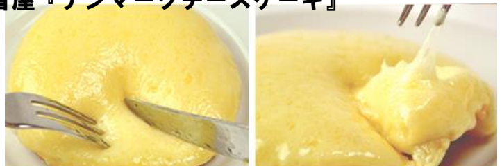
観音屋『デンマークチーズケーキ』