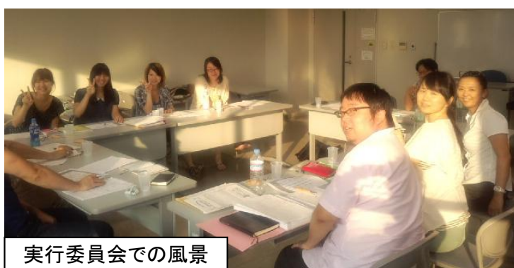
実行委員会での風景

2日間のプログラム内容を話し合っています!! 全員で夢と魔法の国から現実的な学びを研究しています。