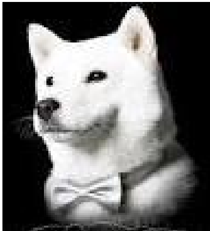
中堅(忠犬)イメージキャラクター